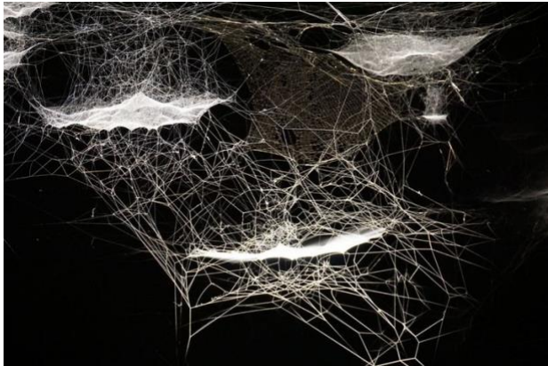
Tomas Saraceno, On air , 2015, Palais de Tokyo, Paris

L'exposition ON AIR se présente comme un écosystème en mouvement, constitué de sculptures constituées par les toiles d'araignées et la présence des arachnides dont les sons sont amplifiés dans l'espace. Il s'agit d'une chorégraphie à plusieurs voix entre humains et non-humains.