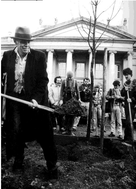
Joseph Beuys, 7000 chênes , Kassel, 1982

Joseph Beuys, pionnier d'un art « écologique », proposait des performances participatives. Lors d'une Documenta à Kassel, il fait œuvre en plantant 7000 chênes dans la ville et en sollicitant la participation des habitants.