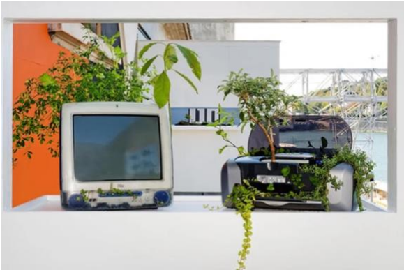
Michel Blazy, Pull over time , détail, Biennale de Lyon, 2015