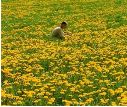
Wolfgang Laib , Pollen de pissenlit , 1990

L'artiste réalise de grandes surfaces de couleur, monochromes posés au sol, constitués de pollen de végétaux. Le temps de la cueillette, extrêmement long et minutieux lui permet un rapport contemplatif et immersif dans la nature