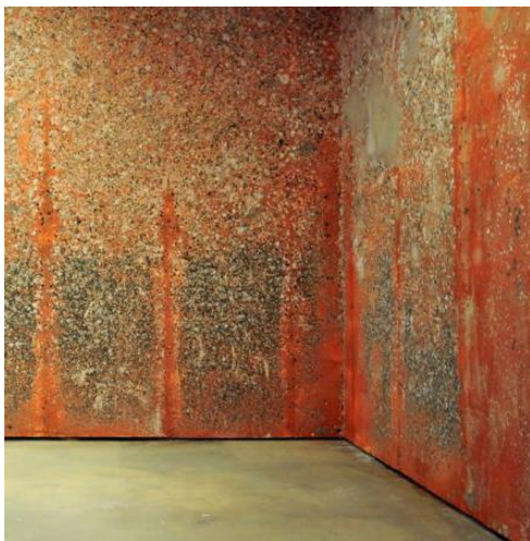
Michel Blazy, Time line , détail, MAMAC, 2018

Plusieurs expositions lui ont été récemment consacrées, notamment : Multiverse , La Loge, Brussels (2019) ; We Were The Robots , Moody Center for the Arts, Houston, TX (2019) ; Living Room II , Maison Hermès, Tokyo (2016), Pull Over Time , Art : Concept, Paris (2015) ; Bouquet Final 3 , National Gallery of Victoria, Melbourne White Night (2013) ; Post Patman , Palais de Tokyo, Paris (2007). Le travail de Michel Blazy a fait partie de l'exposition Viva Arte Viva , curatée par Christine Macel lors de la Biennale di Venezia 2017.